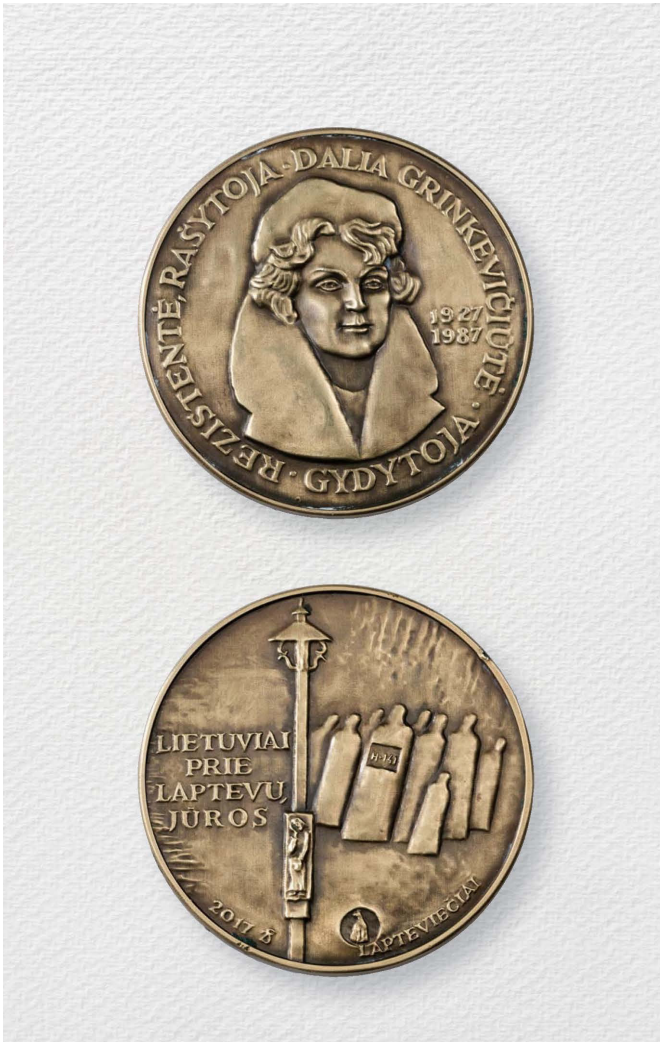
Dalios Grinkevičiūtės atminties ir pagarbos medalis, skiriamas už tiesos liudijimą, tremčių ir laisvės kovų istorijos skleidimą Lietuvoje ir pasaulyje

Aš kartoju sau: laikykis. Laikykis iš paskutiniųjų. Nepasiduok nevilčiai, sukaupti visas savo dvasios jėgas. Jie stengiasi suardyti tavo dvasinę pusiausvyrą ir nieko taip netrokšta – kaip pamatyti tave palaužtą, sugniuždytą, arba nusižeminusią ir vergiškai paklusnią.