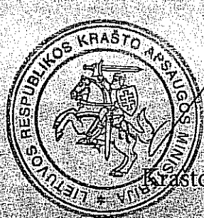
Juozas Olekas Krašto apsaugos ministras

Lietuvos nepriklausomybės atkūrimo dienos proga už ilgametę pavyzdingą ir sąžiningą tarnybą, profesionalumą, iniciatyvumą, nepriekaištingą ir sumanų pareigų vykdymą.